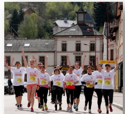
Notre équipe féminine lors de la Run Atitude à Gérardmer !

...et consultez la météo en live grâce à notre webcam !