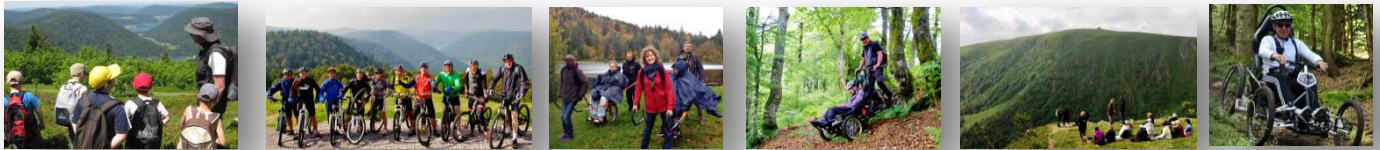
La montagne accessible à tous ! Activités et séjours au rythme de chacun !