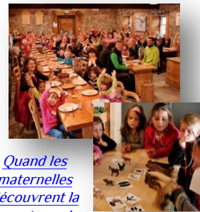
Quand les maternelles découvrent la montagne !