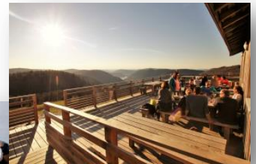
Passez l'été en terrasse !

Familles, randonneurs, groupes d'amis...!