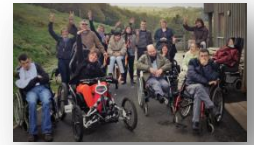
Les Campanules !

L'équipe du refuge remercie chaleureusement les membres et bénévoles de l'association Sotrés, qui sont venus prêter mains fortes en mai !