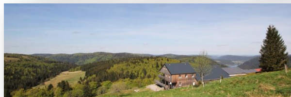
Les jolies couleurs du printemps ! (21/5/2016)