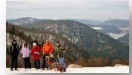
Balade en fauteuil ski !