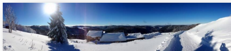
Le refuge en panoramique (20 janvier 2016) !