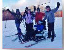
Descente tandem ski !