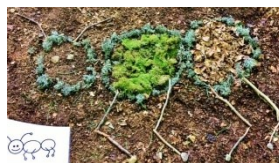
Land Art avec les écoliers du Luxembourg !