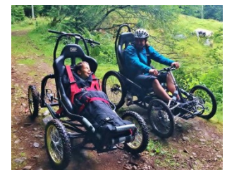
La journée d'Oscar au refuge...

L'équipe du refuge remercie chaleureusement les membres et bénévoles de l'association Sotrés , qui sont venus prêter mains fortes en juillet et août !