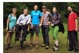
La famille Vaucourt !