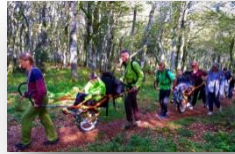
Les résidents de l'HEM Handas en joëlette !