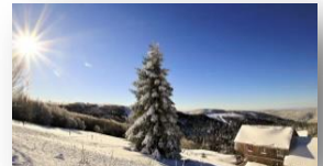
...et d'hiver au refuge !