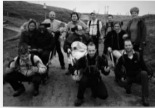
Les résidents du village Michelet en joëlette !