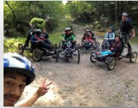
...et en CIMGO & QUADRIX !