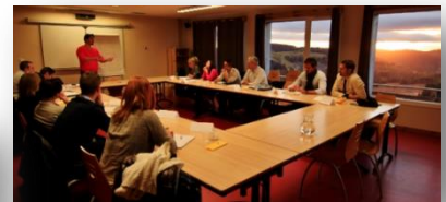
Decathlon, Coca-Cola, Transports MGE, Boiron, EDF, Maisons Brand, Vinci, Garnier Thiebaut...