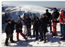
Sports Vacances Loisirs et Ski Joëuf