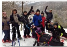
Association Tralal'air !