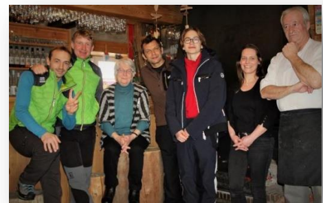
Laurent Mariotte de TF1 !

L'équipe du refuge remercie chaleureusement les membres et bénévoles de l'association Sotrés , qui sont venus prêter mains fortes en février !