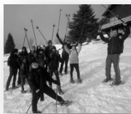
Pôle Action Jeunesse Villers-lès-Nancy