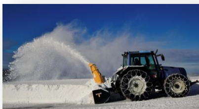
D neigement hiver 2016 / 2017 !